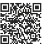
Ilustración: Antonia Santolaya

Bicentenario Carolina Coronado (1820-1911) Antología